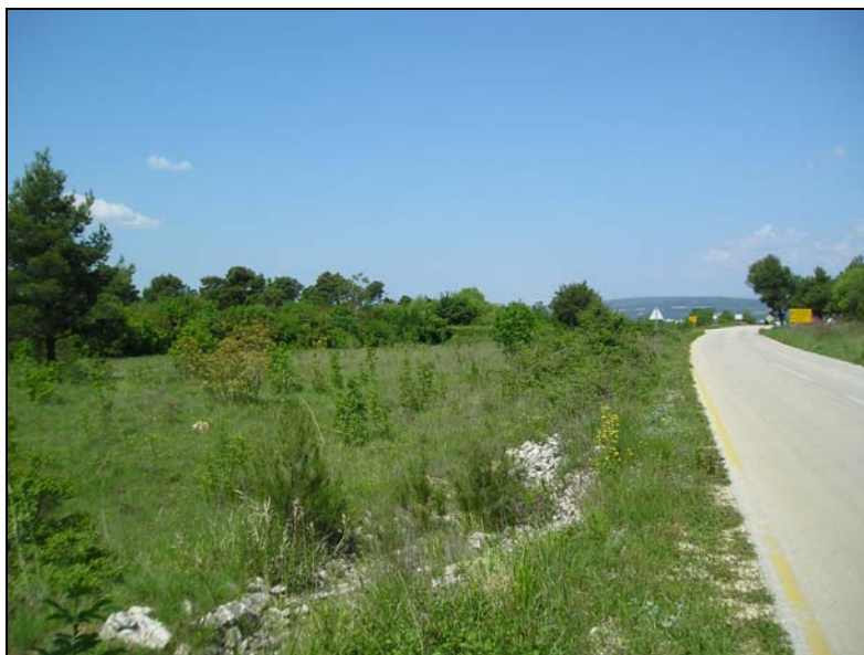
- prostor sa jugozapadne strane županijske ceste Ž6019